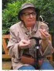
Altern ist nichts für Feiglinge